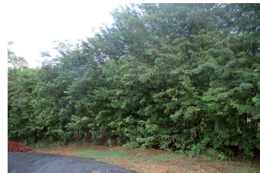
Figura 05: Vista parcial do isolamento de cerca viva, sendo constituída por Sãnsão do campo.