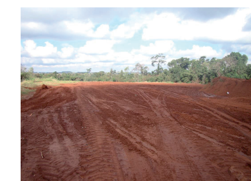
Figura 03: Representação de uma vala completamente ocupada por resíduos, com camada superficial de terra sobre a mesma e que será acrescida de graminas.