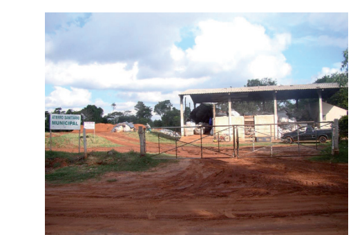
Figura 01: Acesso ao Aterro Sanitário de Altônia - PR.