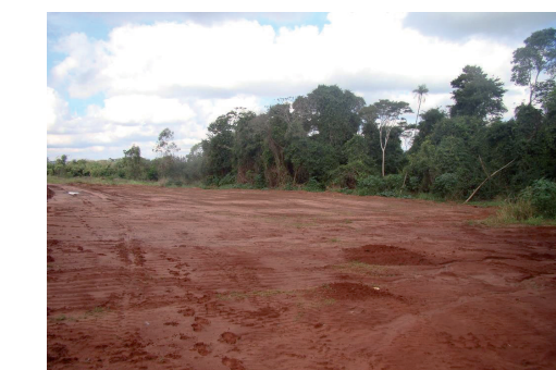
Figura 04: Área sem infraestrutura ao lado da vala utilizada atualmente onde será construída a futura vala.