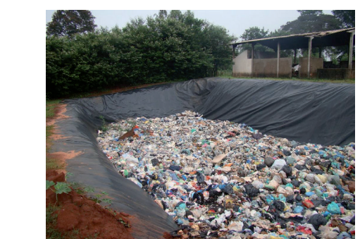
Figura 02: Vala do aterro sanitário em uso.