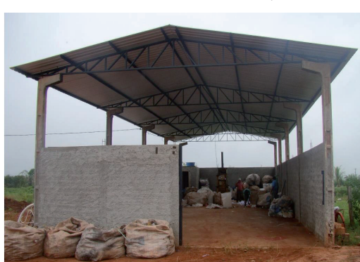
Figura 07: Galpão de reciclagem fora das dependências do aterro sanitário.