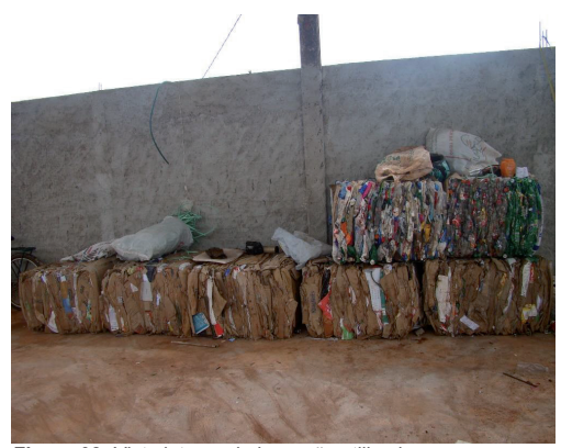
Figura 08: Vista interna do barracão utilizado para armazenamento temporário de resíduos recicláveis com material já prensado pronto para ser comercializado.