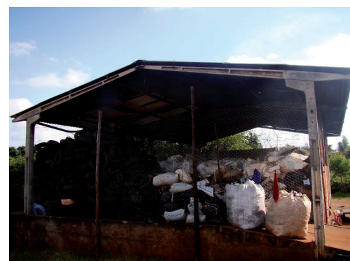
Figura 06: Galpão para armazenamento temporário dos resíduos recicláveis e pneus.