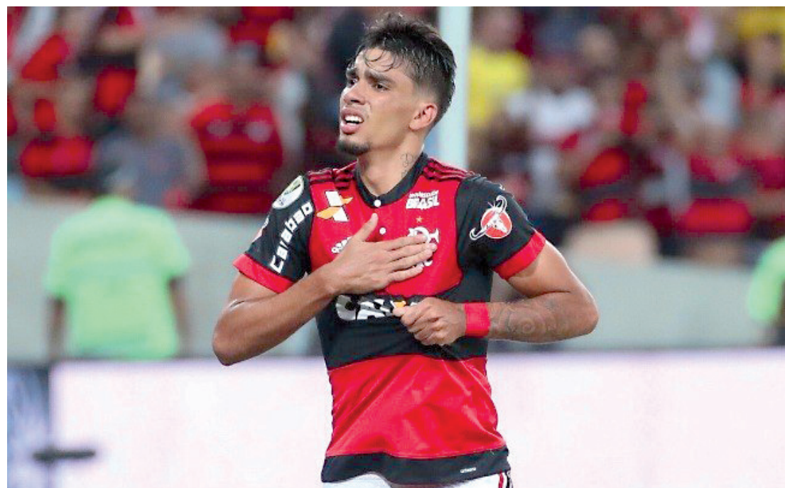
O meio-campista Paquetá acertou transferência para o Milan

A Copa Sul-Americana é, inclusive, o motivo para as dúvidas na escalação do Atlético-PR. O time rubro-negro teve pouco tempo de preparação, pois a partida