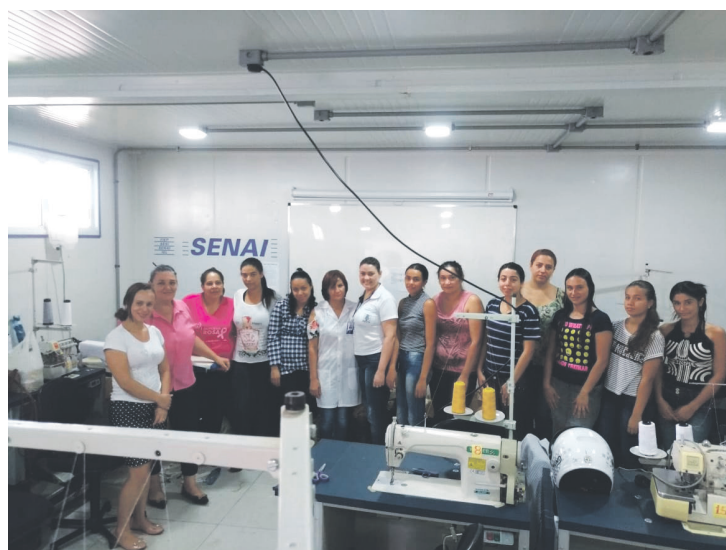
Estudantes do Curso de Costura receberam certificados

Perobal - Foi realizada na Câmara de Vereadores de Perobal terça-feira passada a entrega dos Certificados dos alunos que fizeram os cursos de Costura Industrial, Fabricação de Pães e Bolos Naturais e Integrais e Fabricação de Salgados Assados e Fritos em parceria com o SENAI, e o curso de Garçom em parceria com o SENAC.