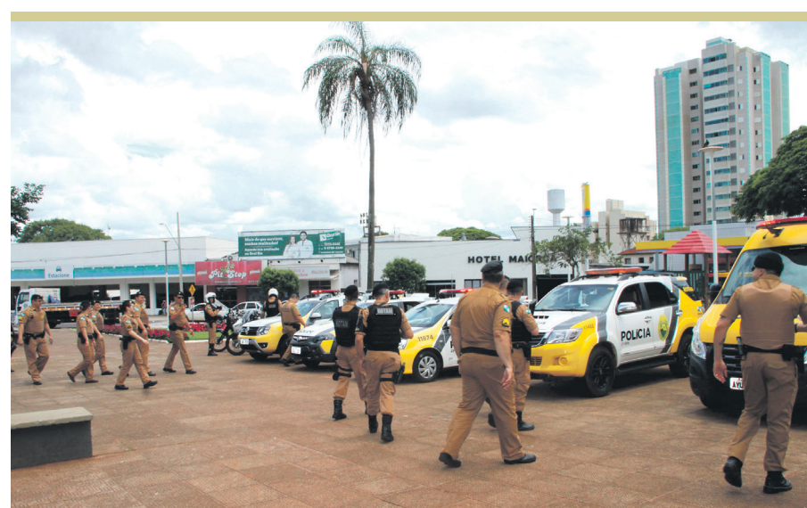
A PM vai estar com presença mais ostensiva nas ruas de Umuarama durante todo o mês de dezembro