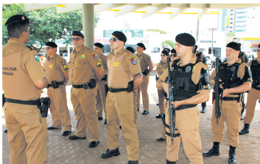
O lançamento oficial da Operação Natal ocorreu às 14 horas de sexta-feira (30) em todo o Estado

“Também vamos realizar operações fiscalizatórias na cidade e também