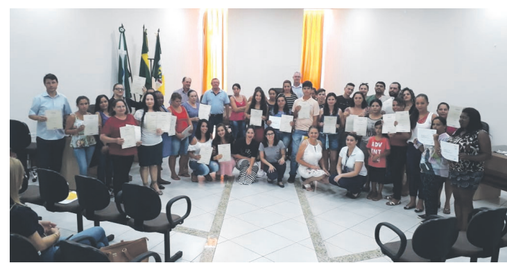
Entrega dos certificados ocorreu na Câmara de Vereadores