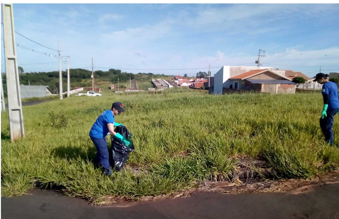
A cidade de Perobal, também realizou atividades educativas e de divulgação contra o mosquito Aedes

"Haverá um trabalho de conscientização e panfletagem nos semáforos próximos à praça, na Avenida Paraná com a Rolândia e com a José Honório Ramos e também na rua Ministro Oliveira Salazar com Avenida Rolândia, além de alguns comércios", informou a presidente do comitê,