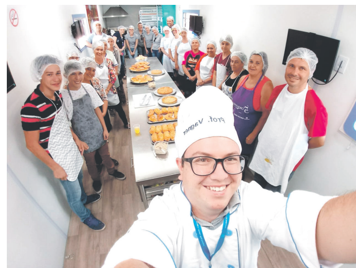
Produção de alimentos formou novos alunos na cidade